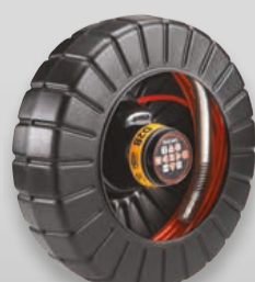
rM200 D2B Tromle