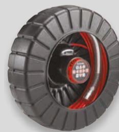
rM200 D2A Tromle